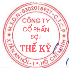
CT. HĐQT Đặng Triệu Hòa