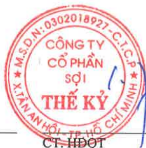
CT. HDQT Đặng Triệu Hòa