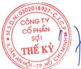
Đặng Triệu Hòa Chủ tịch HĐQT