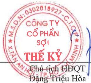
Chủ tịch HĐQT Đặng Triệu Hòa